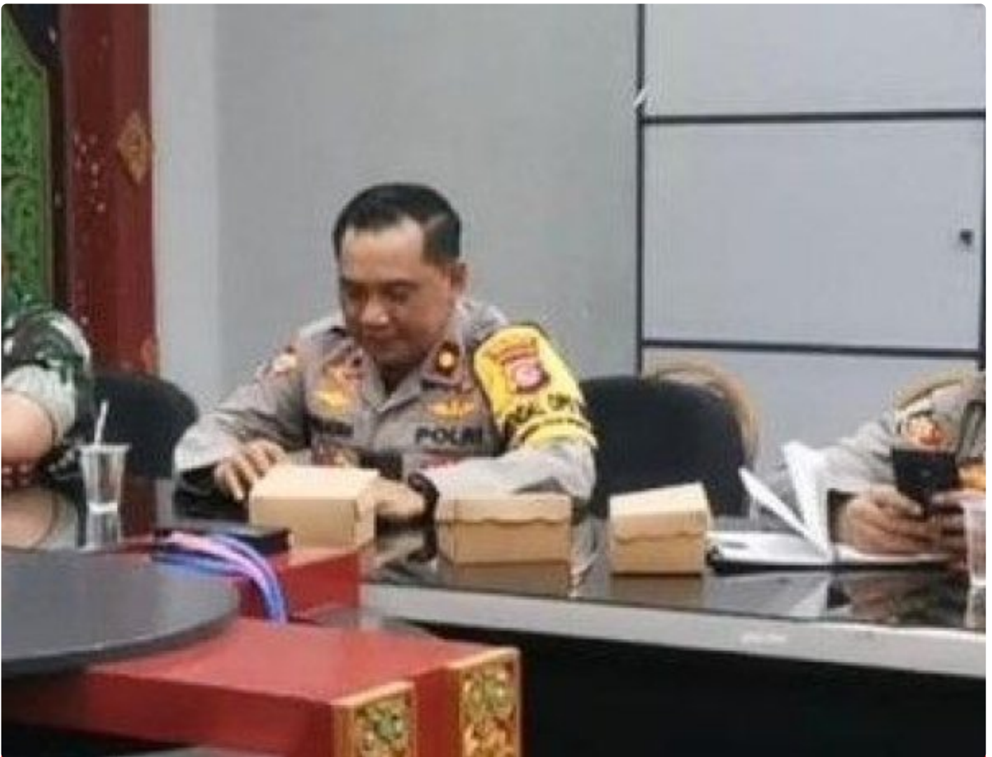
Kabagops Polresta Mataram saat menghadiri Rakor di Kantor Bupati Lombok Barat, Selasa (10/12/2024)

MATARAM, NTB – Dua tradisi budaya ikonik, Pujawali dan Perang Ketupat, akan kembali digelar di Pura Lingsar, Kecamatan Lingsar, Kabupaten Lombok Barat. Persiapan event tahunan ini kian dimatangkan oleh Pemerintah Kabupaten Lombok Barat melalui Dinas Pariwisata Lombok Barat dengan mengadakan rapat